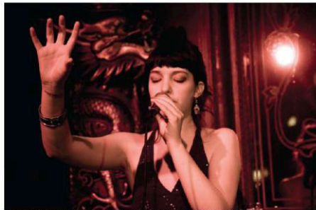
Årshøvid og flere andre begynder her på Popkomm og åbner op for en masse nye og gamle musikere og bands.